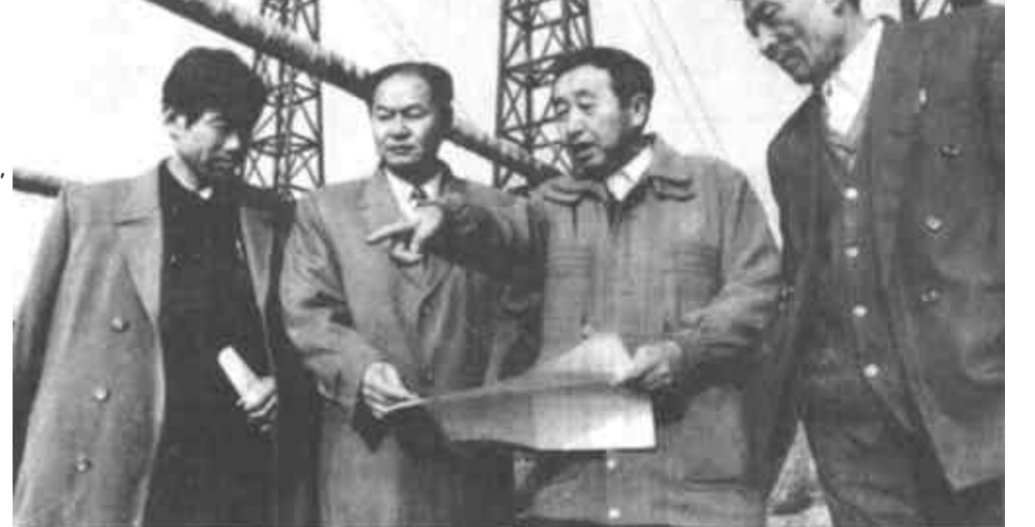
在小清河治理工程东辛公路桥以东750米的施工段上,胜利油田的10余根大型管道南北横贯

杨鲁豫指出,衡量我们工作好坏的标准是群众的需要,我们工作的好坏,要由群众来评判。杨鲁豫指出,衡量我们工作好坏的标准是群众的需要,我们工作的好坏,要由群众来评判。