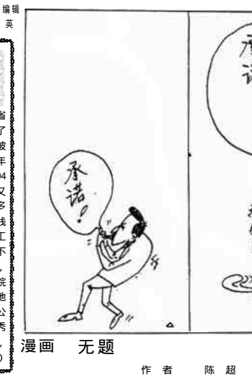
漫画 无题 作者 陈超

供税务登记、纳税申报、税法咨询、涉税举报等一条龙服务。在工作中,文明办税,礼貌待人,亮牌上岗,大力推广使用“文明用语”,禁止使用工作“忌语”。建立了局长走访接待制度,聘请了20余名税风税纪社会特邀监督员,定期发放《征求意见信》在全社会树立了国税干部廉洁务实、文明高效的形象,税收收入稳步增长。(孙怀华 刘国良)